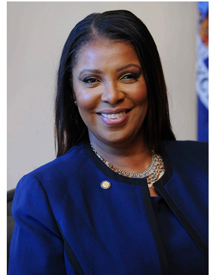
Letitia James Fiscal General