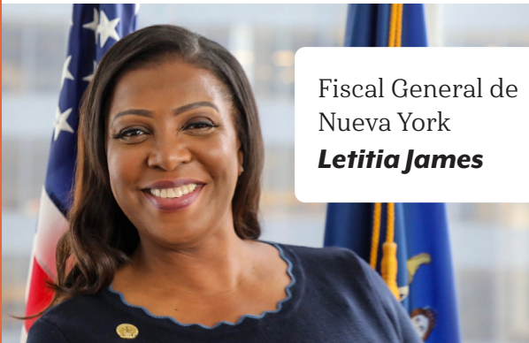
Fiscal General de Nueva York Letitia James