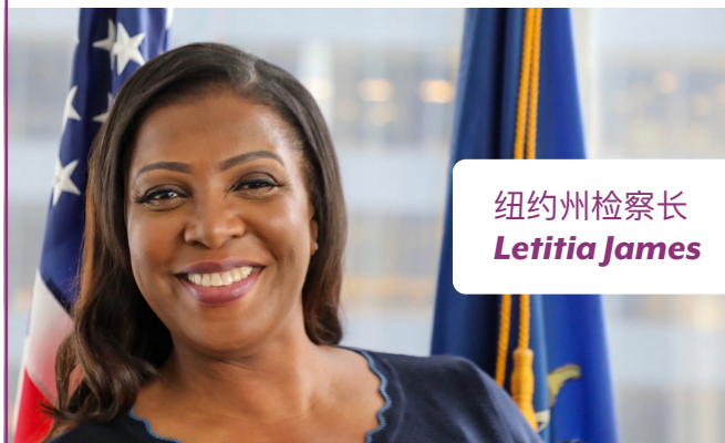
纽约州检察长 Letitia James