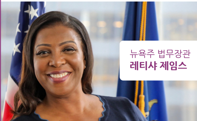
뉴욕주 법무장관 레티샤 제임스