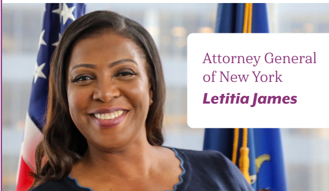
Attorney General of New York