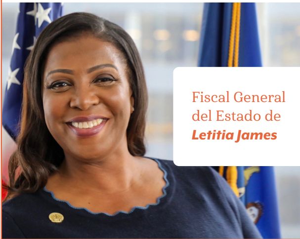
Fiscal General del Estado de Letitia James