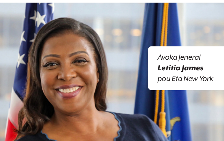
Avoka Jeneral Letitia James pou Eta New York