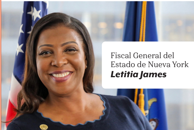
Fiscal General del Estado de Nueva York Letitia James