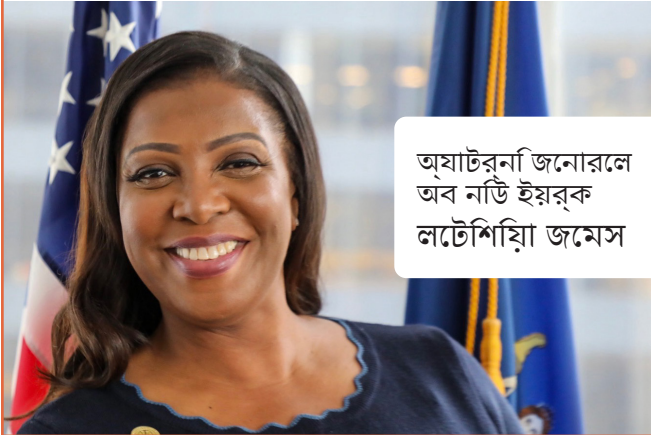
অ্যাটর্নাল জেনারলে অব নিউ ইয়র্ক লেটেশিয়া জমেস