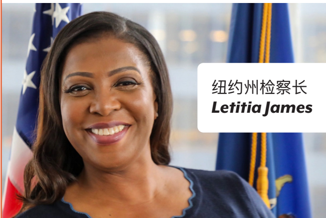
纽约州检察长 Letitia James