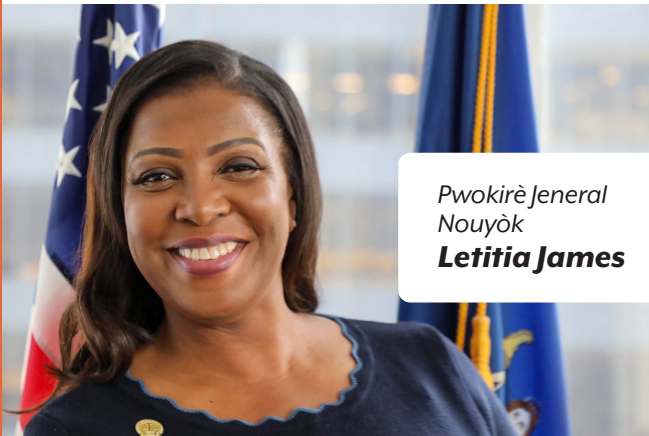
Pwokirè Jeneral Nouyòk Letitia James