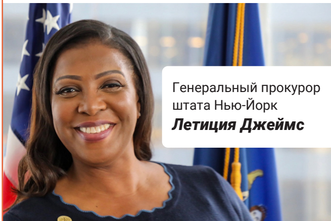
Генеральный прокурор штата Нью-Йорк Летиция Джеймс