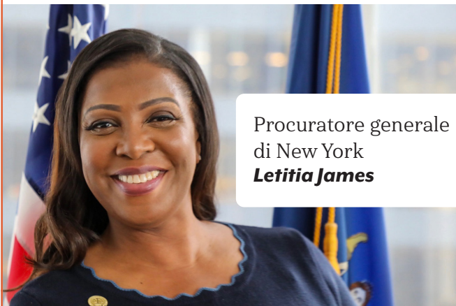
Procuratore generale di New York Letitia James