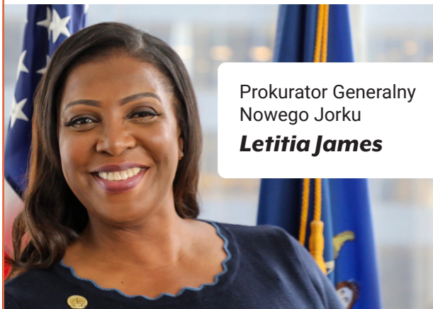
Prokurator Generalny Nowego Jorku Letitia James