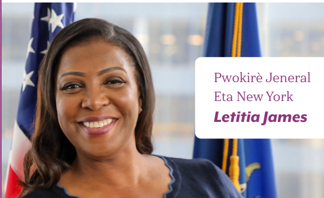
Pwokirè Jeneral Eta New York Letitia James