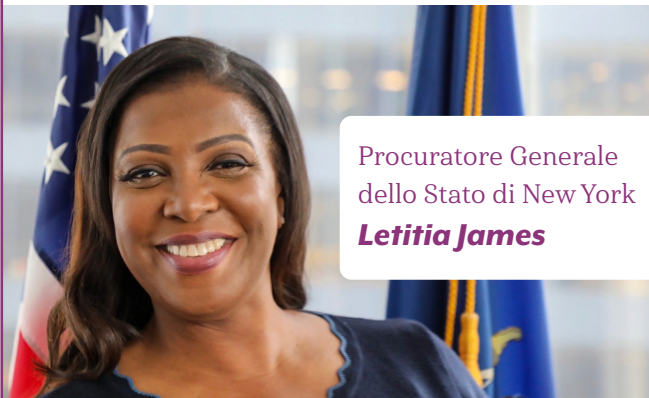
Procuratore Generale dello Stato di New York Letitia James