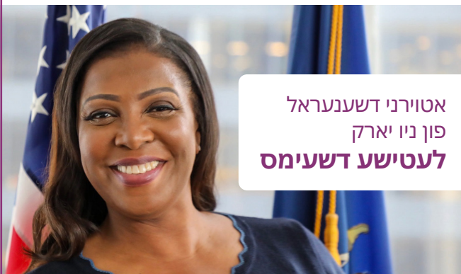
אטורני דשענעראל פון ניו יארק לעטישע דשעימס