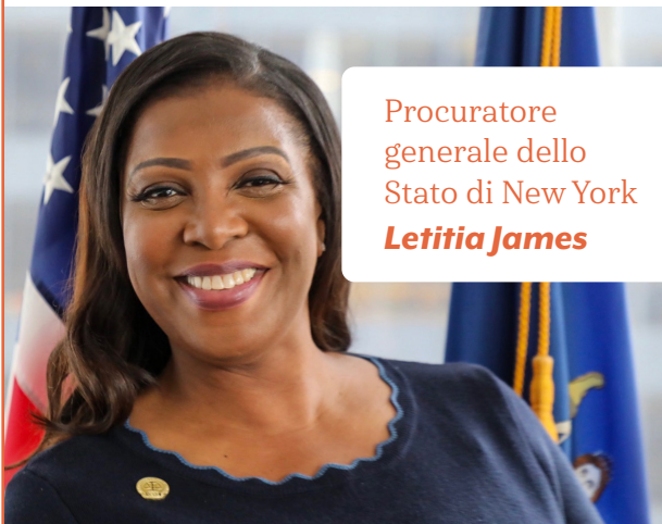
Procuratore generale dello Stato di New York Letitia James