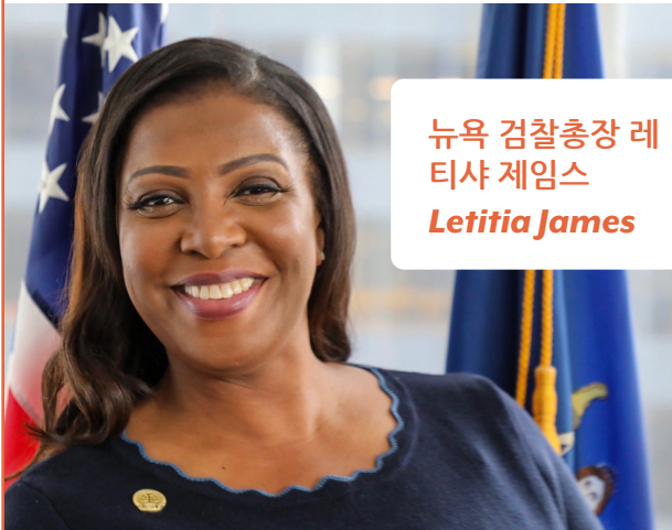
뉴욕 검찰총장 레 티샤 제임스 Letitia James