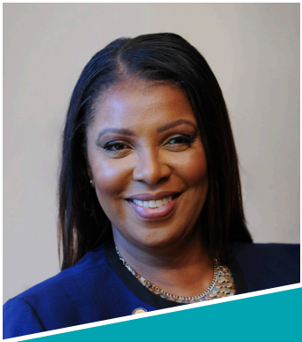
Avoka Jeneral Letitia James pou eta New York