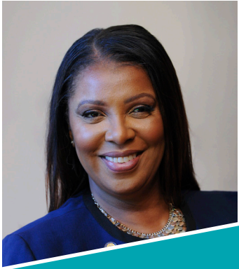
뉴욕 검찰총장 레티샤 제임스 (Letitia James)